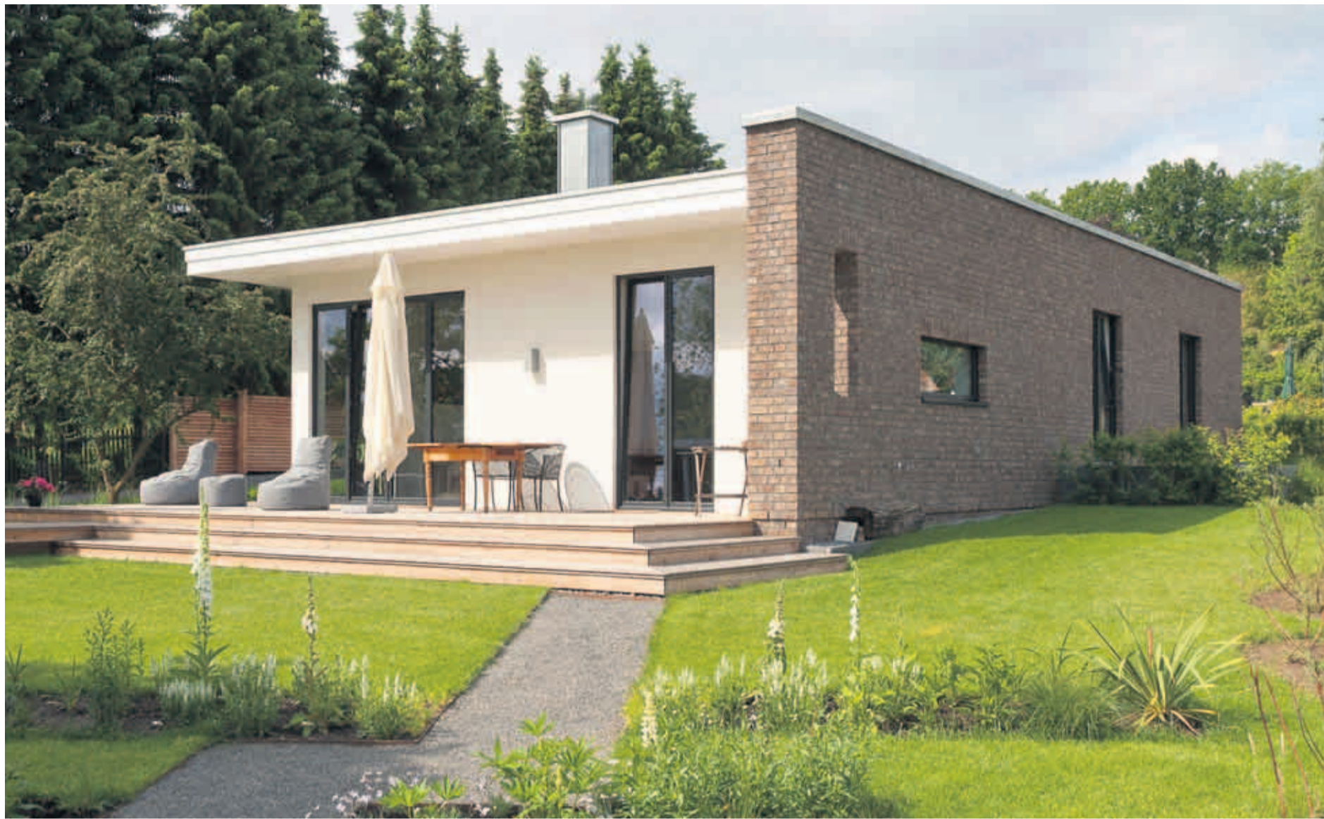
Vorne liegt der Putzbau mit auskragendem Dach, der an seiner Wetterseite von einer Wandscheibe aus Verblendmauerwerk geschützt wird.

Für ihre Studie hat die Bank die Wohnimmobilienmärkte in den 14 Städten Berlin, Bremen, Dresden, Düsseldorf, Frankfurt/Main, Hamburg, Kiel, Köln, Leipzig, München, Potsdam, Rostock, Schwerin und Stuttgart untersucht. Wohnungspreise und -mieten zogen demnach im vergangenen Jahr spürbar an. Im Bundesdurchschnitt legten Mehrfamilienhäuser in Großstädten 2011 im Wert um gut acht Prozent zu, die Preise für Eigentumswohnungen kletterten um 6,8, bei Neubauten um 9,7 Prozent. Die Mieten für Altbauten stiegen bundesweit um etwa 4,3 Prozent, bei Neubauten legten sie im Erstbezug um 4,9 Prozent zu. (HA)