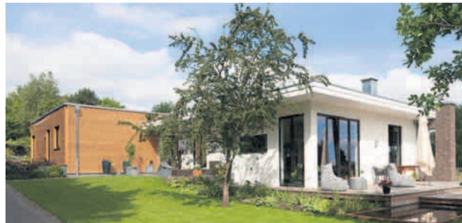
Jede Wohneinheit ist ein eigenständiger Baukörper: oben am Hang ein Kubus in Holzfassade für die Eltern, im Vordergrund der Putzbau für die Tochter

„Diese Bauweise hat weiterhin den Vorteil, dass außer durch den eingebrachten Estrich und die Malerarbeiten keine Feuchtigkeit ins Gebäude gerät und so die Gewerkeabfolge ohne Berücksichtigung sonstiger Trocknungsphasen nach einem strengen Bauablaufplan fließen kann“, sagt Jacobsen. Die Installationsleitungen wurden zudem in einer inneren Installations-